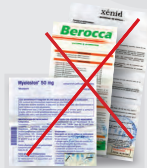
Vignettes et P.P.M. des médicaments à joindre à l'ordonnance