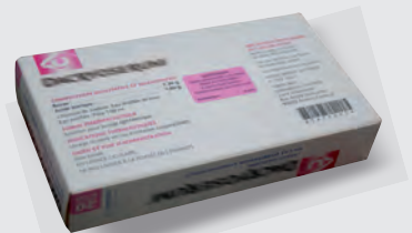
A conserver par le bénéficiaire, sauf en cas d'absence du code à barres national, les joindre au dossier