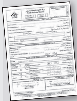
Feuille de soins cachetée et signée par le médecin traitant