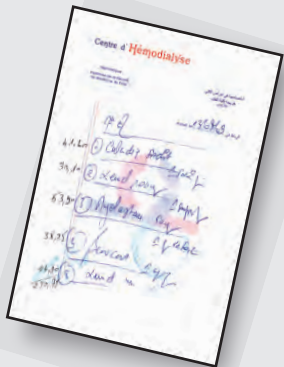
Ordonnance signée et cachetée par le médecin traitant